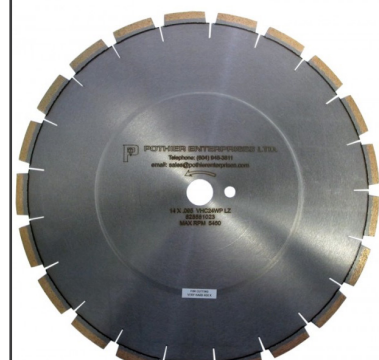
Discos de Corte