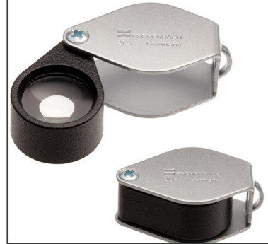
Lupas 10x, 14x y 20x