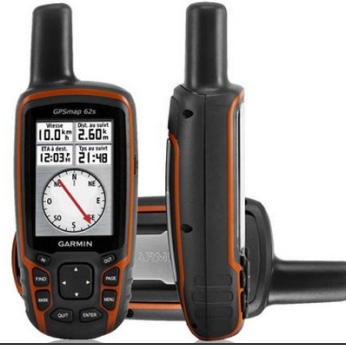
Brújulas, GPS, Libretas