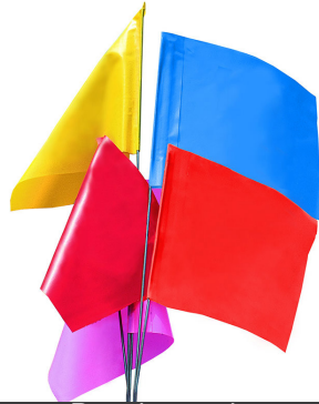
Banderas de Señalamiento