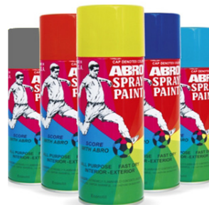
Pintura en Spray