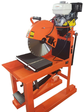
Cortadoras de núcleo