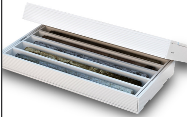
Cajas para núcleo